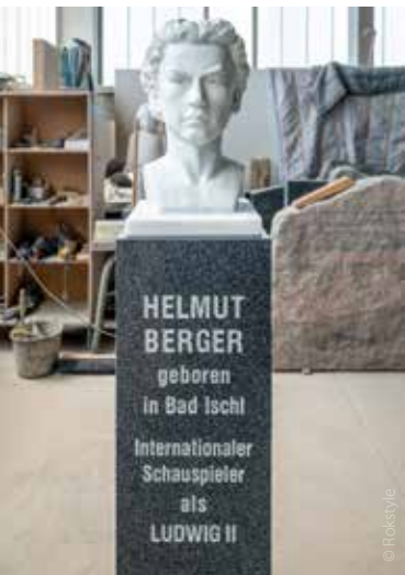
HELMUT BERGER BÜSTE Ehrung zum 75. Geburtstag