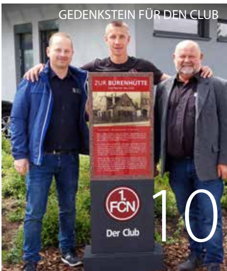
GEDENKSTEIN FÜR DEN CLUB